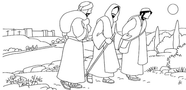
Les disciples d' Emmaüs